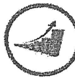
ความมั่งคั่ง