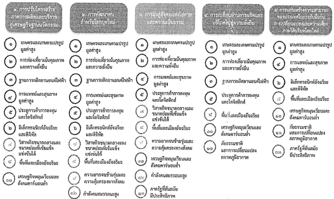
แผนภาพที่ ๓.๑ ความเชื่อมโยงระหว่างหมวดหมู่การพัฒนากับเป้าหมายหลัก

ความเชื่อมโยงระหว่างหมวดหมู่การพัฒนากับเป้าหมายหลักแสดงไว้ในแผนภาพที่ ๓.๑ โดยหมวดหมู่ การพัฒนาที่กำหนดขึ้นเป็นประเด็นที่มีลักษณะเชิงบูรณาการที่ครอบคลุมการพัฒนาตั้งแต่ในระดับต้นน้ำ จนถึงปลายน้ำ และสามารถนำไปสู่ผลพัฒนาทั้งในมิติเศรษฐกิจ สังคม ทรัพยากรธรรมชาติและสิ่งแวดล้อมไป พร้อมๆ กัน ทำให้หมวดหมู่แต่ละประการสามารถสนับสนุนเป้าหมายหลักได้มากกว่าหนึ่งข้อ นอกจากนี้ การพัฒนาภายใต้แต่ละหมวดหมู่ไม่ได้แยกขาดจากกัน แต่มีการสนับสนุนหรือเอื้อประโยชน์ซึ่งกันและกัน